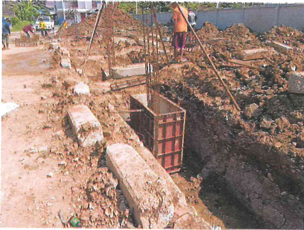
ภาพถ่ายดำเนินการการก่อสร้างอาคารชุดพักอาศัยข้าราชการ ๑๘ หน่วย พร้อมสิ่งก่อสร้างประกอบ เรือนจำอำเภอแม่สอด งานงวดที่ ๑ และงานงวดที่ ๒